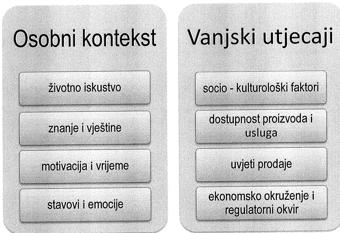
Slika 2. Elementi koji utječu na donošenje financijskih odluka:

Kod utjecanja na ponašanje prilikom donošenja financijske odluke, mnoge zemlje imaju prilagođen pristup prema životnoj dobi. To zahtijeva odgovarajuće informacije i podršku u pravome trenutku kako bi se riješio trenutni problem ili kako bi se dobila pravovremena informacija potrebna za donošenje financijske odluke. Tijekom vremena, spomenute interakcije ili tzv. 'trenuci učenja' otvorit će put prema učenju drugih vještina, razvijajući osobne snage i iskustvo, kao i širenje znanja i sposobnosti. To može pomoći ljudima pri povećanju osobne fleksibilnosti kako bi bili sposobniji izbjegavati financijsku krizu ili stres te razviti veći kapacitet za odmak od svojih financijskih problema.