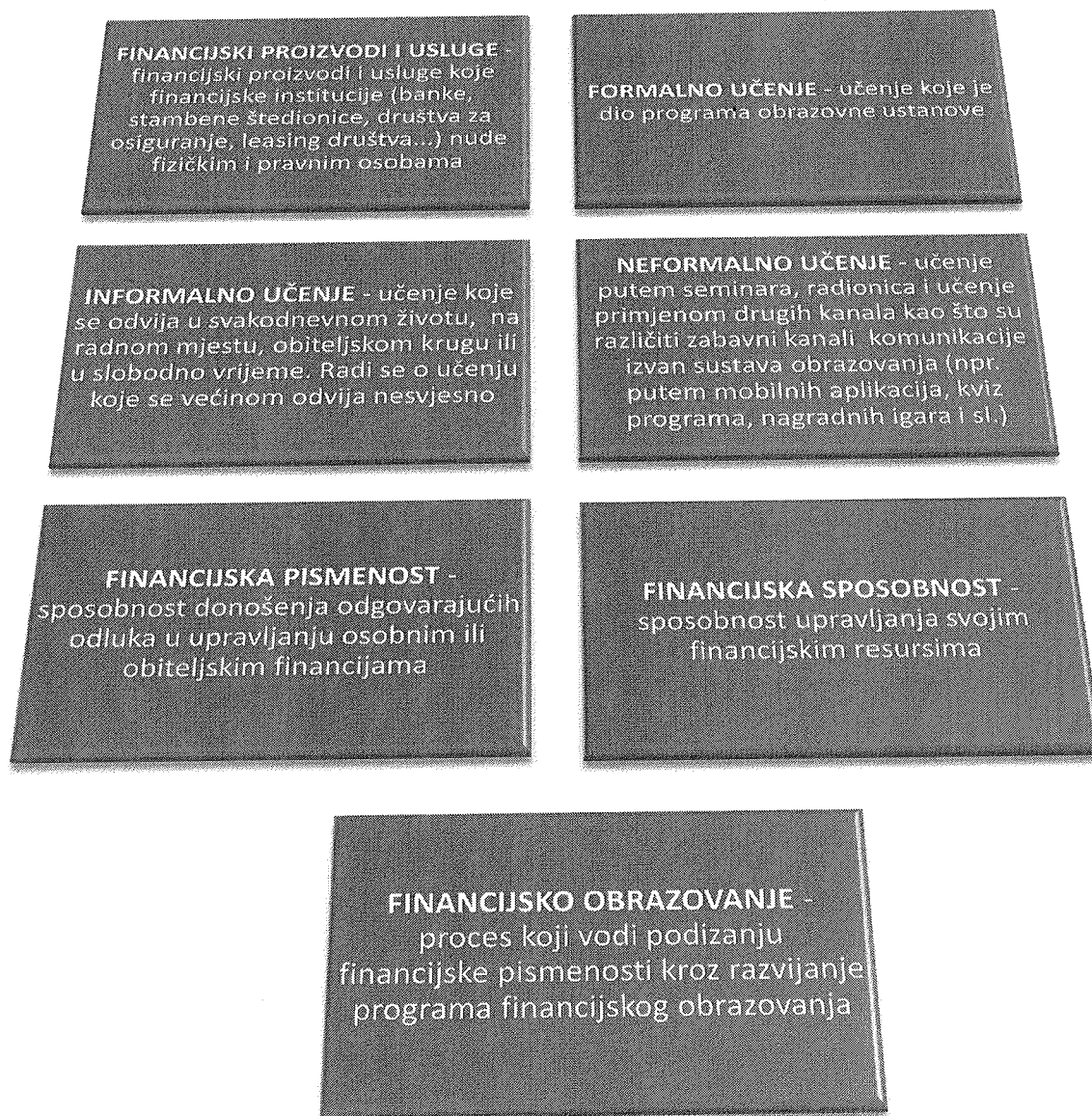
Slika 1. Osnovni pojmovi i njihovo značenje

Temeljni pojmovi u smislu ovog Nacionalnog strateškog okvira financijske pismenosti potrošača imaju sljedeće značenje: